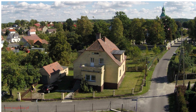
Przedszkole w Czerwonej Wodzie

Przedszkole mieści się w budynku po byłym przedszkolu publicznym. Są tu 4 sale, dwie służą do zabaw, a pozostałe dwie przeznaczona są do zajęć i na posiłki. W budynku mieści się również zaplecze kuchennym oraz szatnia i umywalnia. Budynek od lat nie był remontowany i wymaga pełnej termomodernizacji łącznie z modernizacją kotłowni. Konieczne jest również zagospodarowanie terenu wokół przedszkola wraz z wymianą ogrodzenia.