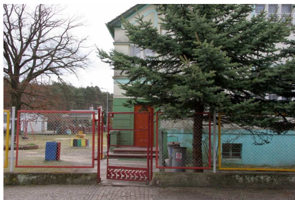
Przedszkole w Ruszowie