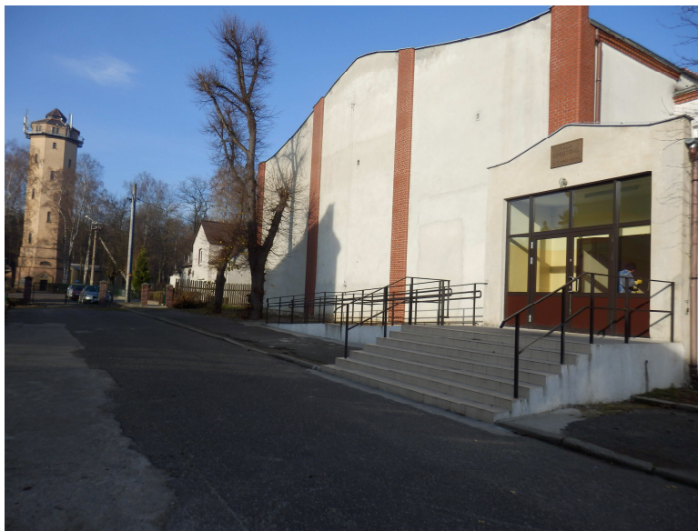
Sala sportowa w Węglińcu

W ramach Rządowego Programu „Radosna Szkoła” na terenie szkoły utworzono funkcjonalny plac zabaw dla dzieci.