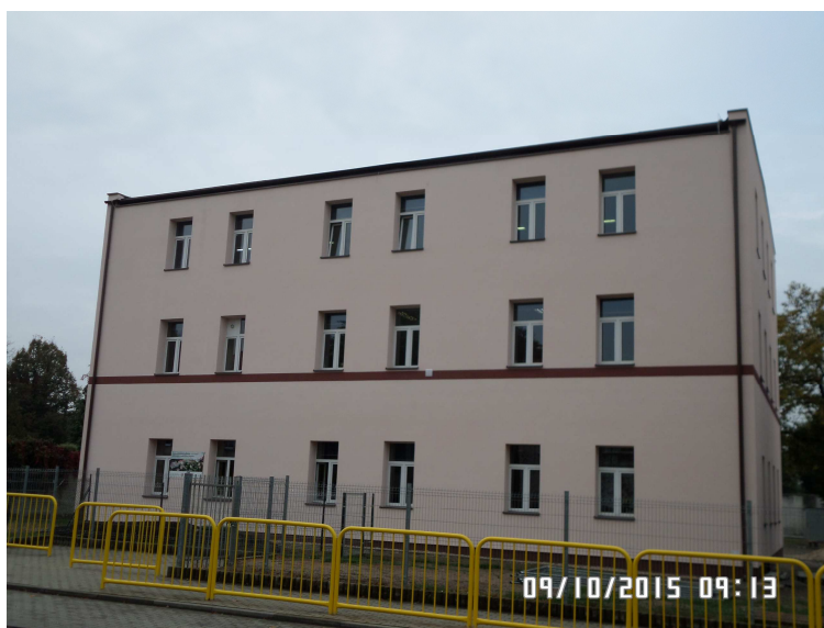
Gimnazjum w Ruszowie

Gimnazjum mieści się w budynku, który po wojnie był odremontowany i przystosowany na potrzeby szkoły podstawowej jako świetlica szkolna, a od 2000 roku stanowi bazę lokalową dla Ruszowskiego gimnazjum. Budynek posiada obecnie 5 sal lekcyjnych, pracownię języków obcych, jedną pracownię komputerową z 10 stanowiskami komputerowymi oraz gabinet pedagoga. Ponadto w budynku znajduje się kuchnia wraz z