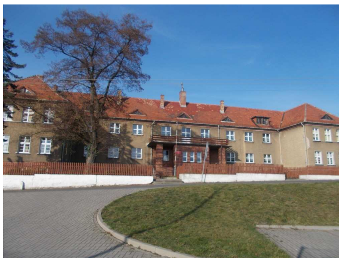
Szkoła Podstawowa w Czerwonej Wodzie

Szkoła mieści się w starym przedwojennym budynku. W budynku jest 8 sal lekcyjnych, 1 pracownia komputerowa z 10 stanowiskami komputerowymi zakupionymi w ramach Rządowego Programu „Cyfrowa szkoła”, sala dla oddziału zerowego, pokój nauczycielski, gabinet dyrektora, sekretariat, sanitariaty, pomieszczenie socjalne, sala gimnastyczna. W suterenie jest biblioteka szkolna, szatnie dla uczniów, gabinet pedagoga i logopedy, gabinet pielęgniarki szkolnej oraz jadalnia dla osób objętych programem dożywiania. Do szkoły należy również sąsiadujący z budynkiem głównym, budynek gospodarczy. W szkole brakuje pracowni do nauczania języków obcych oraz pracowni przyrodniczej. Istnieje potrzeba zakupu nowego wyposażenia do sal dydaktycznych oraz nowoczesnych pomocy naukowych, jak również konieczne jest wyremontowanie ogrodzenia terenu szkoły. Budynek szkoły jest przystosowany dla osób niepełnosprawnych ruchowo poprzez zamontowanie platformy.