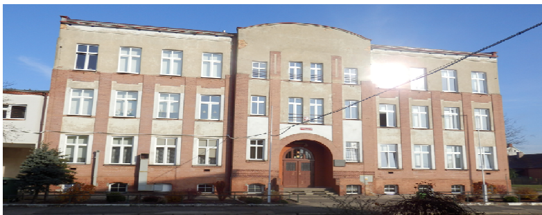
Gimnazjum w Węglińcu

Gimnazjum mieści się w starym budynku postawionym jeszcze przed II wojną światową. Budynek posiada obecnie 13 gabinetów przedmiotowych, świetlicę, gabinet pedagoga, pokój nauczycielski, gabinet pielęgniarki szkolnej oraz gabinet dyrektora i sekretariat. Gimnazjum ma do dyspozycji jedną pracownię komputerową z 10 stanowiskami komputerowymi. Pracownię należałoby wyposażyć w nowy sprzęt komputerowy oraz nowe meble dla tego typu sali. Istnieje potrzeba zakupu nowego wyposażenia do dwóch sal dydaktycznych oraz nowych pomocy naukowych. W szkole brak szatni dla uczniów. Budynek jest częściowo dostosowany do potrzeb osób niepełnosprawnych - jest winda ułatwiająca komunikację pionową, ale brak jest odpowiednich toalet.