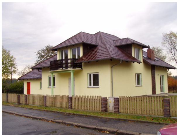
Przedszkole w Węglińcu

Przedszkole publiczne w Węglińcu od 2004 roku mieści się w nowej siedzibie. Liczba miejsc w przedszkolu wynosi ogółem 70. Od momentu uruchomienia przedszkola w nowym miejscu, ma ono zarezerwowane wszystkie miejsca. W budynku są 3 dobrze wyposażone sale zabaw, przy których znajdują się łazienki i szatnie oraz sale do zabaw przestrzennych: muzycznych, plastycznych, ruchowych.