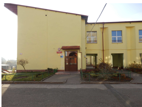
Szkoła Podstawowa w Węglińcu