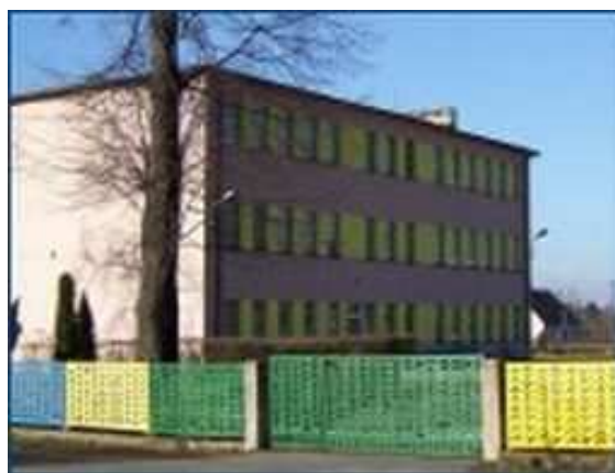
Szkoła Podstawowa w Starym Węglińcu

ul. Główna 50, Stary Węglińiec, 59-940 Węglińiec