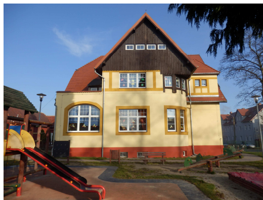
Świetlica szkolna

Szkoła ta mieści się w dwóch budynkach. W budynku głównym, na parterze i pierwszym piętrze jest 12 sal lekcyjnych, w tym 5 przystosowanych jest do prowadzenia zajęć przedmiotowych oraz gabinet dyrektora, pokój nauczycielski oraz gabinet