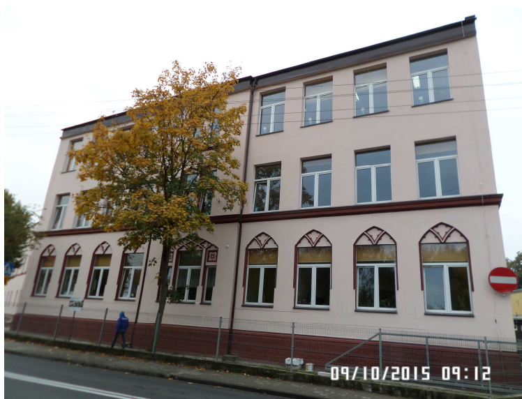
Szkoła Podstawowa w Ruszowie

Szkoła mieści się w starym budynku postawionym przed II wojną światową. W budynku szkoły mieści się 11 sal lekcyjnych, pracownia komputerowa z 10 stanowiskami komputerowymi i multimedialnym projektorem i biblioteką. W budynku są również 2 sale dla sześciolatków, gabinet dyrektora i sekretariat szkoły, pokój nauczycielski, gabinet logopedy, gabinet pedagoga szkolnego, i gabinet pielęgniarki szkolnej Oprócz tego, w budynku szkoły podstawowej mieści się świetlica szkolna w suterenie budynku.