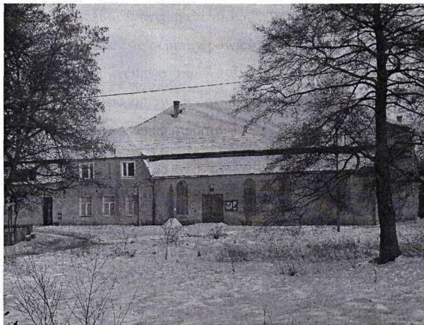
Rys.3 Dom Kultury w Jagodzinie

Najważniejszymi obiektami zabytkowymi są obiekty objęte ewidencją zabytków. W Jagodzinie są to głównie cmentarz komunalny oraz budynki XIX-wieczne - dom kultury, dawna poczta.