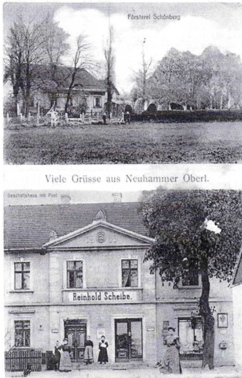
Rys. 2 Jagodzina przed II wojną światową