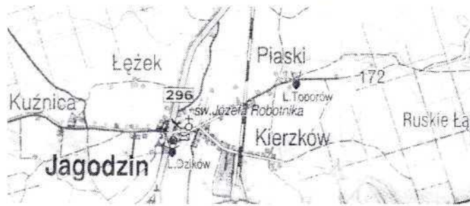
Rys.4 Układ dróg w Jagodzinie